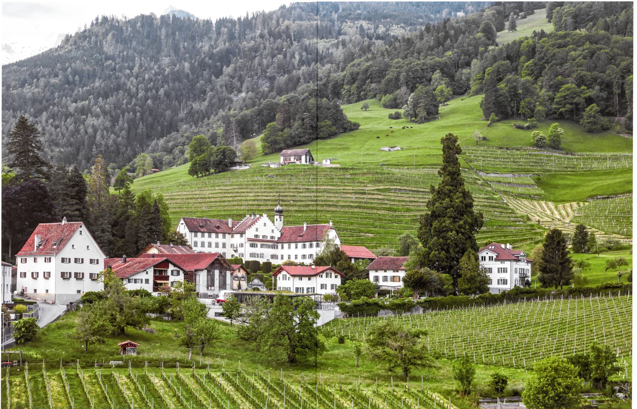
Schloss Bothmar, Sitz der Familie von Sallis, in der Grünzone Iseppi 5. Vor dem Schloss liegt die 1,8 Hektaren grosse Grünzone Scadena 4.