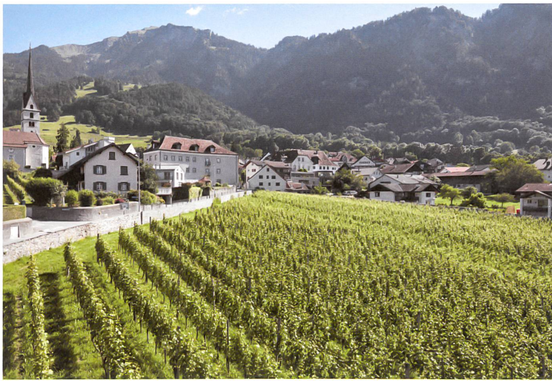
In der Bildmitte das grosse, graue Haus Schmid, rechts davon das Bäckerhaus mit Ställen. Die Grünzone Unter Bongert 3 mit knapp einer Hektare ist der Weinberg dieses Ensembles.