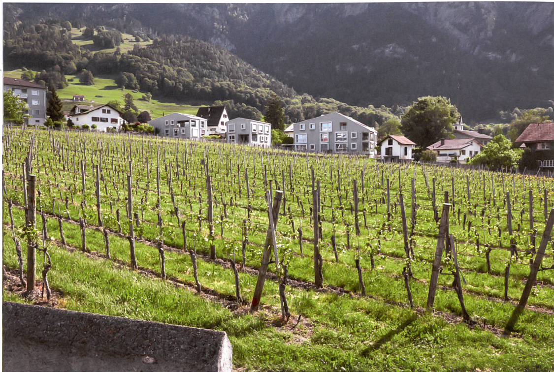
Privilegiertes Wohnen am Rand der Grünzone Markstaller 1. Sie ist knapp eine Hektare gross.

Gemeinde bewilligte Projekt gibt es Einsprachen. Der Bau werde der grösste Torkel im Dorf und bräuchte den Ausbau einer bestehenden Fahrspur zu einem 160 m langen Schotterrasenweg. Befürchtet wird auch eine künftige Nutzung als Gastwirtschaft. Die Einsprecher wollen, dass auch Winzer ihre Betriebe in Bau- und nicht in Grünzonen erweitern, was hier gut möglich wäre. Sie meinen, dass auch ein herausragender Architekt eine Grünzone schwäche, wenn in ihr gebaut werde.