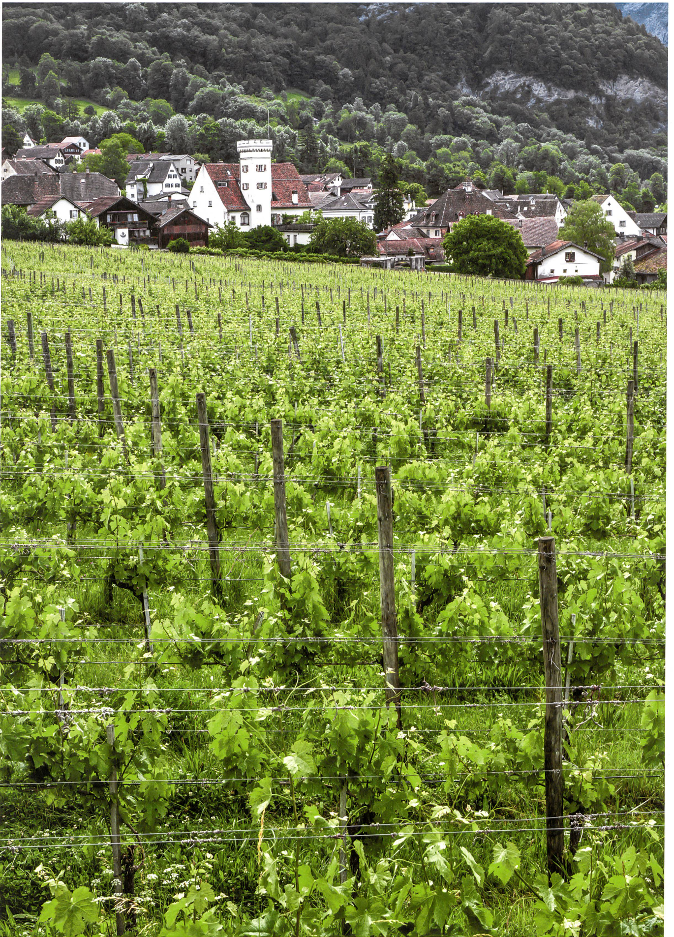
Küng und Ratschelga 2, angrenzend an die Kirche und umgeben von dichter Bebauung, ist mit vier Hektaren die grösste Grünzone und das landschaftliche Juwel von Malans.