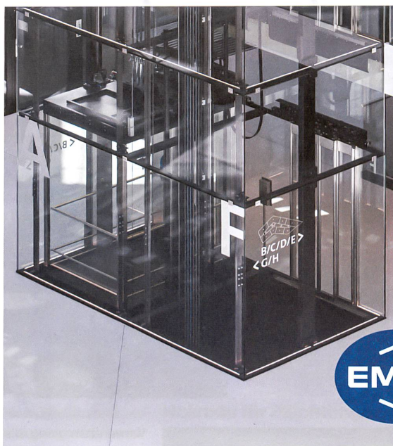
Businesspark – Ittigen Atelier 5 Architekten und Planer – Bern

Bauen Sie einen Lift, der so ist wie Sie – einzigartig.