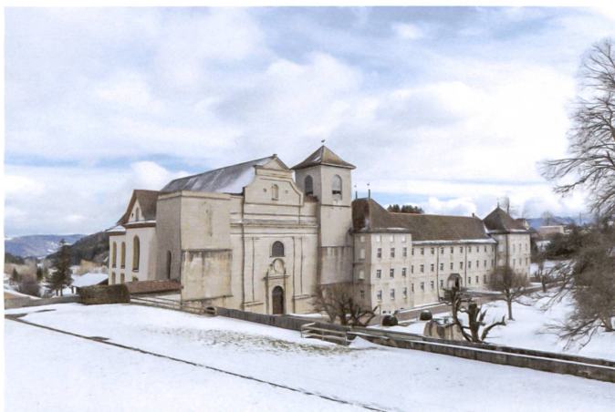
Im stumpfen Nordturm der Abteikirche von Bellelay verbirgt sich ein neuer Lift.