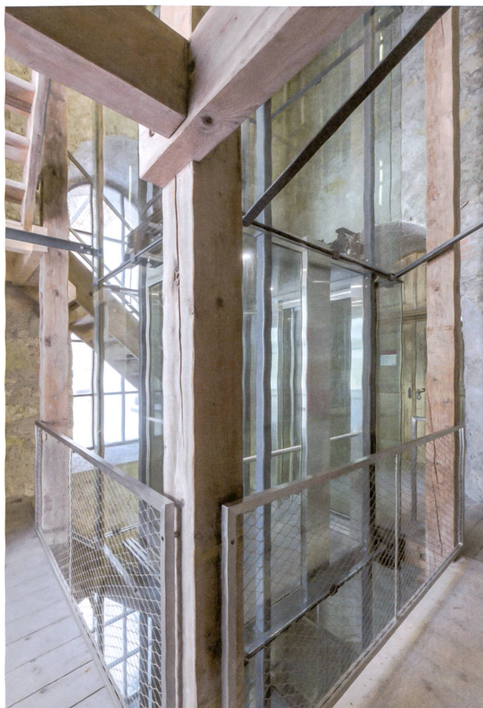
Mit grösstmöglicher Transparenz wollte der Architekt den Lift ins Auge der Holzterre einfügen.

Lift und Schachtgerüst: EMCH Aufzüge AG, Bern