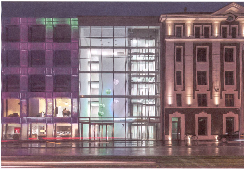
Neue Fassade, alte Fassade, dazwischen die Eingangshalle mit Liftturm.