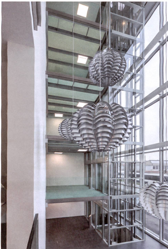
Auch der Liftschacht und die Zwischenpodeste stammen von Emch.