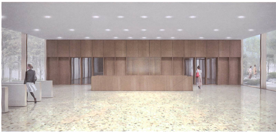
Zwei Lifte sind in die holzverkleidete Wand der Eingangs- halle integriert.