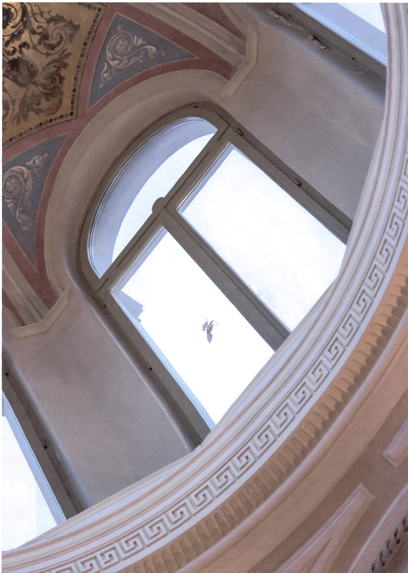
Uccelin in der Lichtkuppel der Villa Planta, Sitz des Bündner Kunstmuseums in Chur.