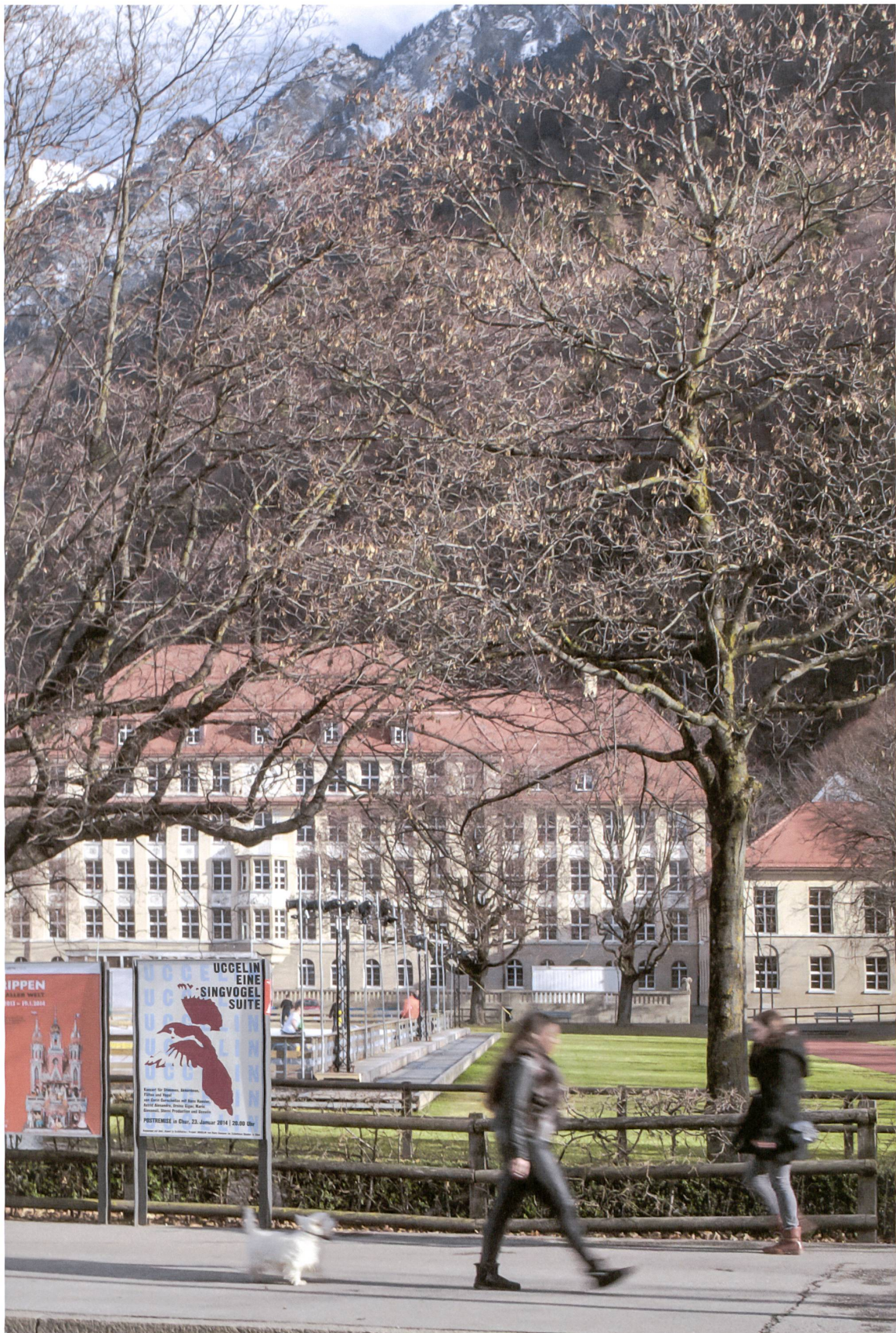
Schulanlage Quader in Chur. Im Vordergrund das Plakat für «Uccelin – eine Singvogel Suite».