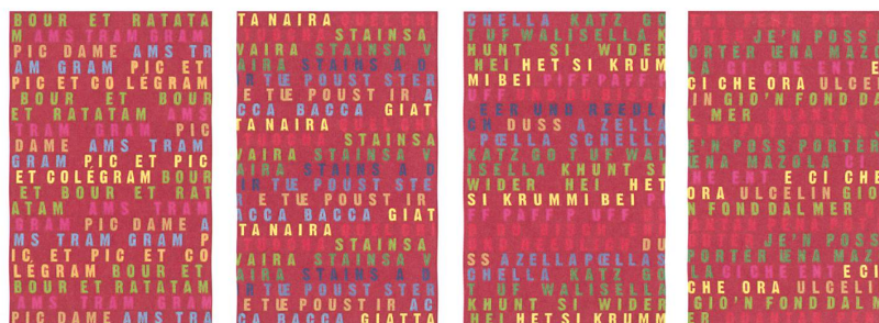
Farbentwurf des «allover» für die vier Säulen im Foyer des Quaderschulhauses in Chur mit Abzählreimen in je einem Dialekt der vier Sprachregionen der Schweiz.