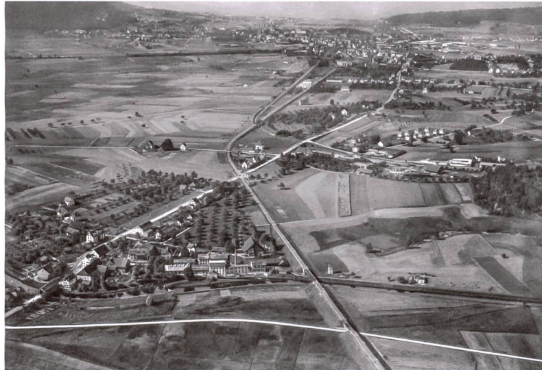
Flugaufnahme von Walter Mittelholzer, 1925: Das Oberhauserriet liegt im linken oberen Viertel des Bildes; im Vordergrund links Glattbrugg. Foto: ETH-Bibliothek, Bildarchiv