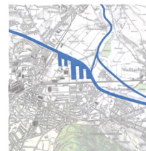
Zwei Hafenprojekte für das Oberhauserriet von 1915 und 1920.