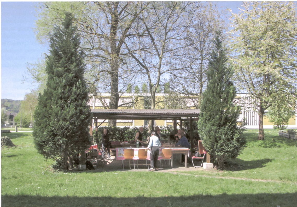
Der viel frequentierte, selbst gebaute Gartenpavillon, würdig gerahmt.