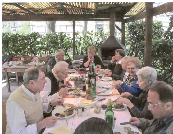
Zum spontan organisierten Essen bringt jeder mit, was er gerade hat.