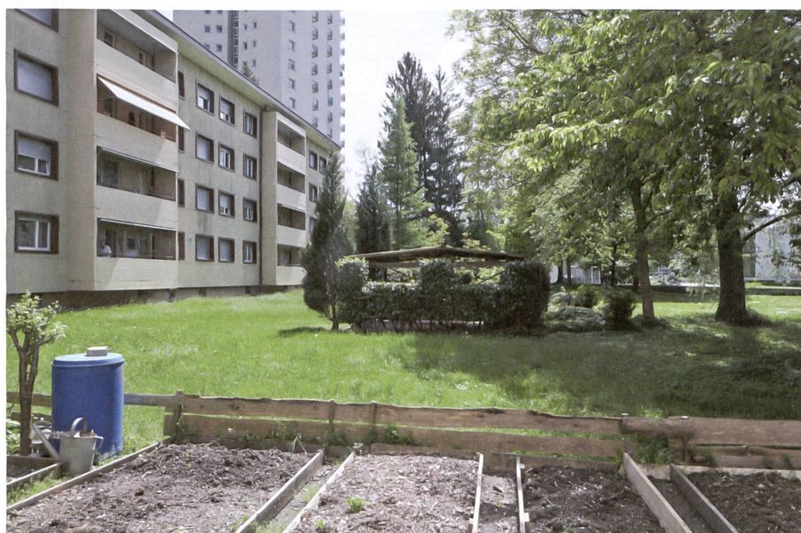
Bewohnerinnen und Bewohner haben sich vor über dreissig Jahren den Grünraum angeeignet.