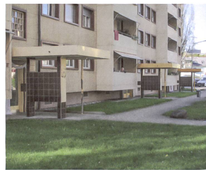
Nüchterne Hauseingänge auf der Strassenseite.