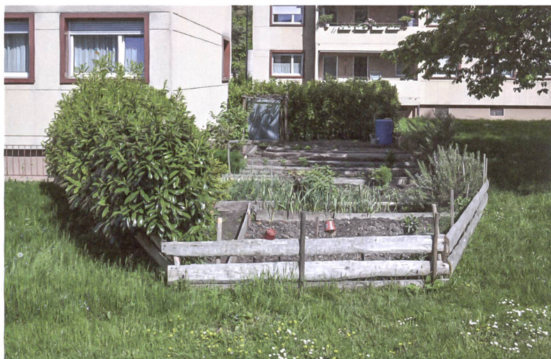
Lebensdienliche Italianità in Schwamendingen.