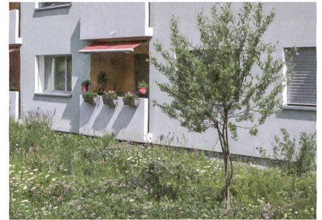
Natur und Architektur treffen übergangslos aufeinander.