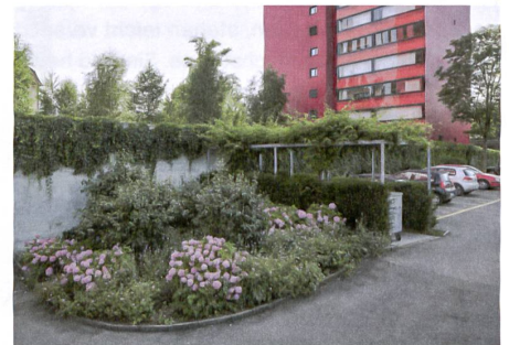
Die Bepflanzung der Eingangszone ist einladend gestaltet.