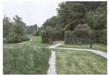
Weiträumigkeit durch landschaftsarchitektonische Mittel beim mit Hecken eingefassten Grillplatz.

Siedlung Glanzenberg Glanzenbergstrasse 12, 26/28, Dietikon ZH Bauherrschaft: Siedlungs-genossenschaft Eigengrund (SGE) Nutzung: 281 Bewohnerinnen und Bewohner