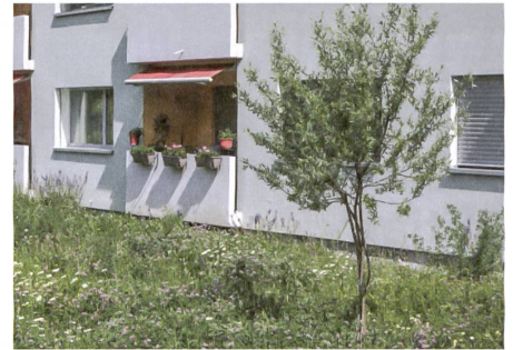
Natur und Architektur treffen übergangslos aufeinander.