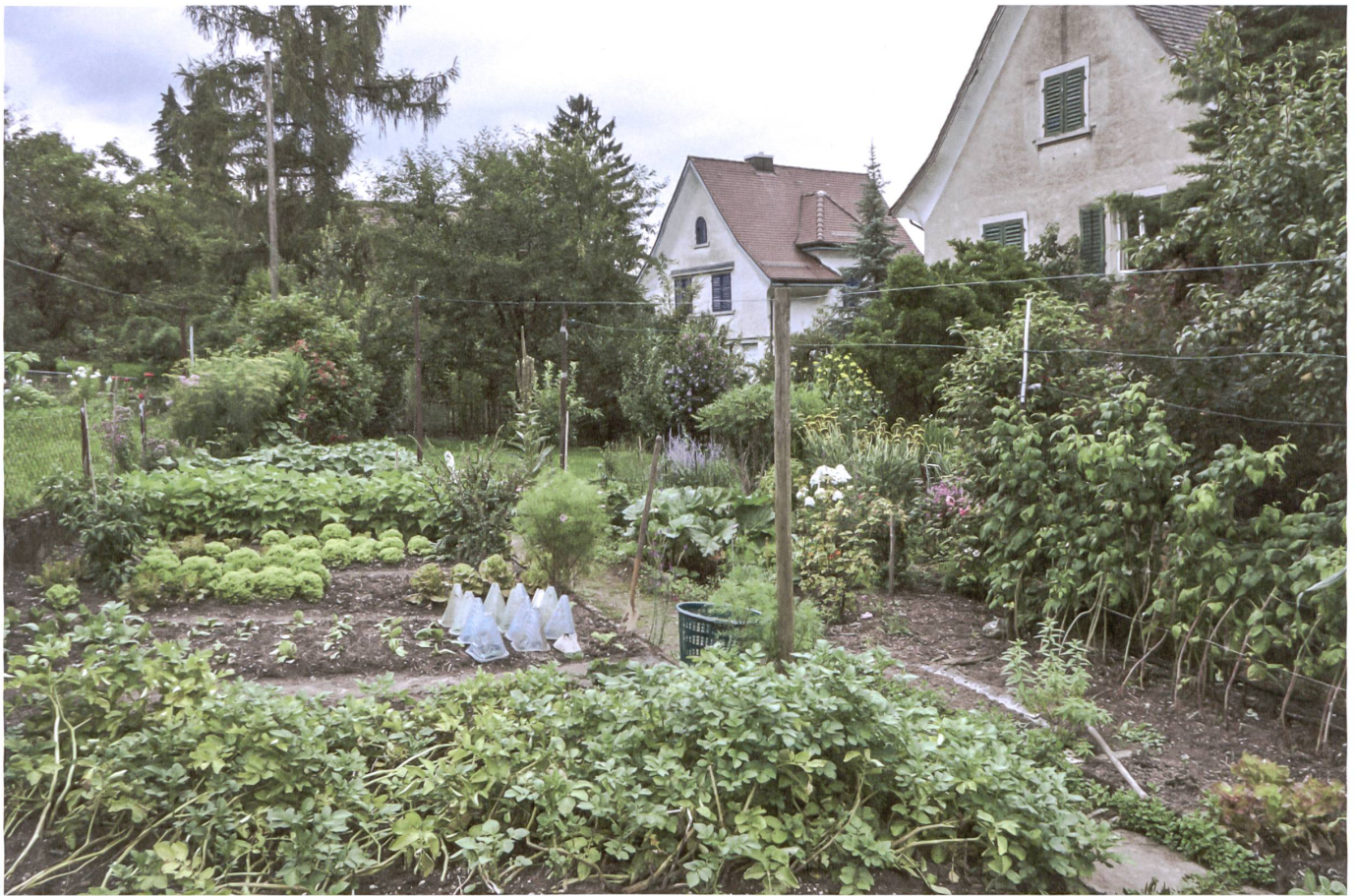
Noch heute praktizieren die beiden älteren Damen weitgehende Selbstversorgung – mit Hilfe der Enkelin für die schwere Arbeit.

Arbeit, eisernes Lernen nach dem Vorbild ihres Mannes oder anderer Menschen geworden. Es brauchte viele Jahre der Erfahrung im Garten, der genauen Beobachtung, des Ausprobierens, des Verbesserns und Anpassens, um das Gartenhandwerk zu erlernen und der eigenen Intuition zu vertrauen. Inzwischen gibt sie ihr breites Wissen nicht nur ihrer Tochter, sondern auch ihrer Enkelin weiter. Über die regelmässigen Tätigkeiten im Garten wird dieses Wissen ständig erneuert und vertieft. Können schnell abgerufene digitale Apps ein solches solide über Praxis erworbenes Wissen ersetzen?