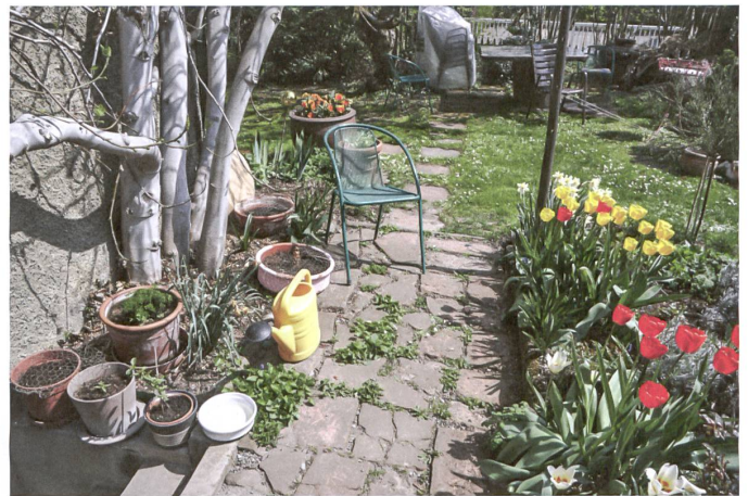
Ein Plätzchen an der Sonne.

und Garten zusammen. Ab und zu gesellt sich ein Verwandter aus dem weiten Familienkreis hinzu und bewohnt die obersten Zimmer – mal für längere, mal für kürzere Zeit. Parallel dazu haben sich die lose aneinandergereihten Gartenräume, die den Garten um das Haus herum subtil strukturieren, mit der Zeit zwar den Bedürfnissen entsprechend etwas verwandelt – aber nur wenig. Sie bieten vielfältige Möglichkeiten für eine gärtnerische Betätigung, aber auch für ein abwechslungsreiches Verweilen.