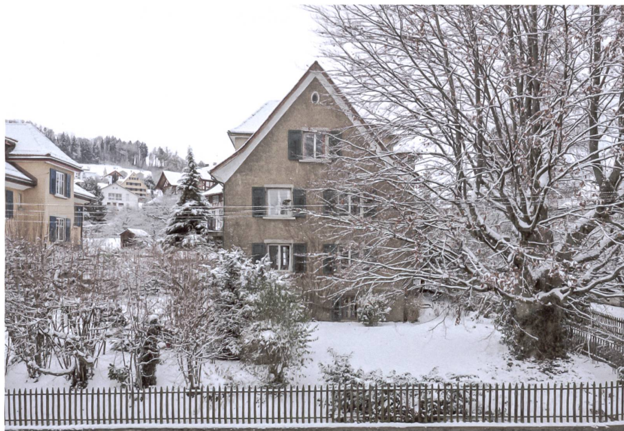
Das 1912 erbaute Haus Stüssi in Wädenswil mit seinem stattlichen Garten.