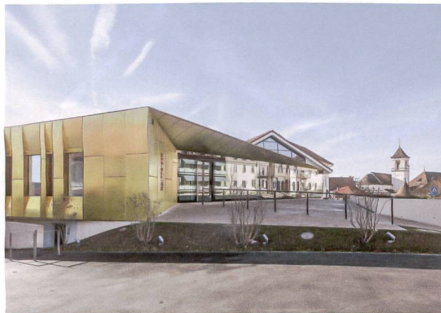
Saignelégier JU: Apart Architektur.