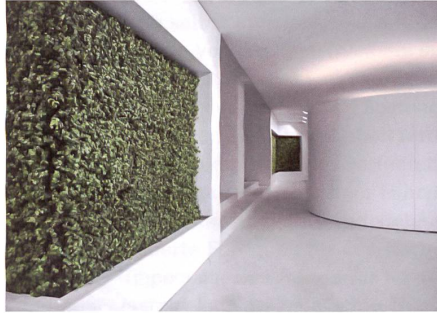
Chur GR: Giubbini Architekten.