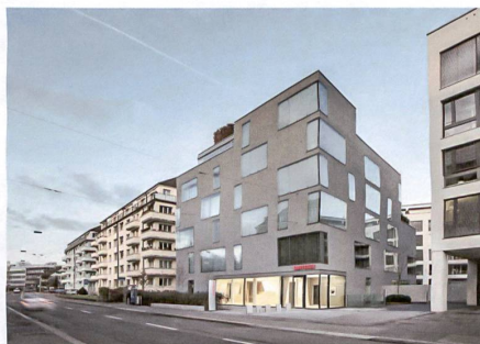
Zürich-Kreuzplatz: DGI/NAU Architekten.