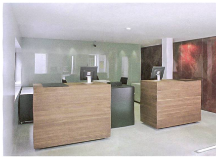
Brienz BE: Aebi & Vincent Architekten.