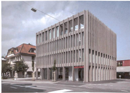
Küssnacht SZ: Lütolf und Scheuner Architekten.