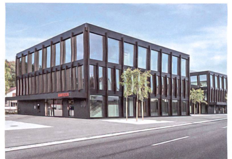
Untersiggenthal AG: Liechti Graf Zumsteg Architekten.