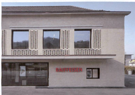
Zufikon AG: Edelmann Krell Architekten.