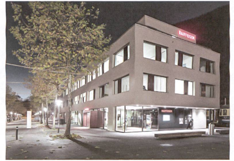
Interlaken BE: Von Allmen Architekten.