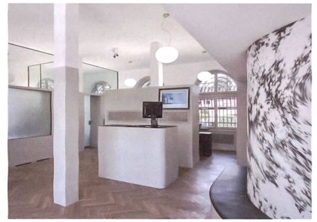
Bern-Bümpliz: Althaus Architekten.