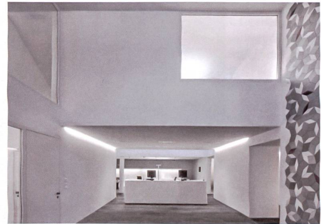
Reckingen VS: Albrecht Architekten.