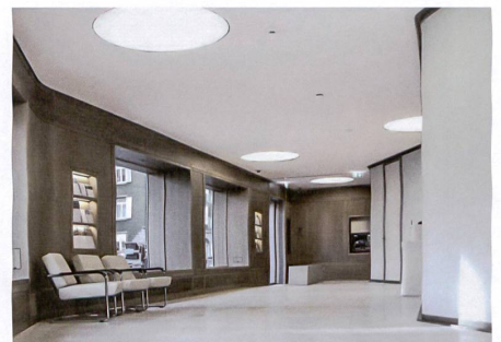
Zürich-Wiedikon: Fiechter & Salzmann Architekten.