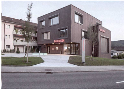
Nussbaumen AG: Rolf Graf & Partner Architekten.