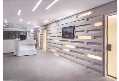
Eggwil BE: Werk Architekten.