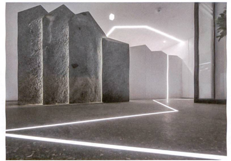
Brigels GR: Maurus Cathomas.