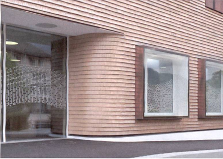
Château d'Oex VD: Architecum.