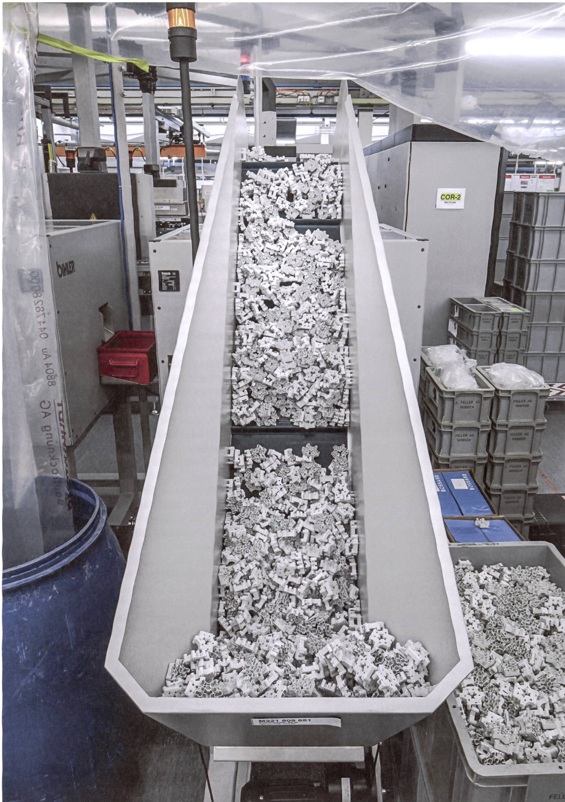
Diese Teile der Dreifachsteckdose sind später nicht mehr sichtbar – in die Kunststoffgehäuse werden die Klemmen gelegt.