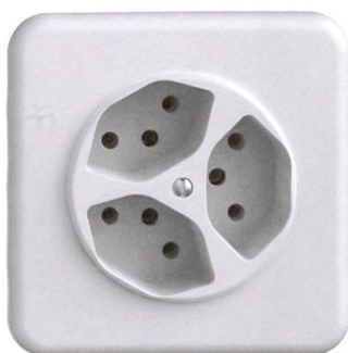
Die neue Dreifachsteckdose (T13) hat nun eine schützende Vertiefung.

Wer das Projektteam und die Maschinen in Aktion sehen will, findet das Coregon-Video auf: