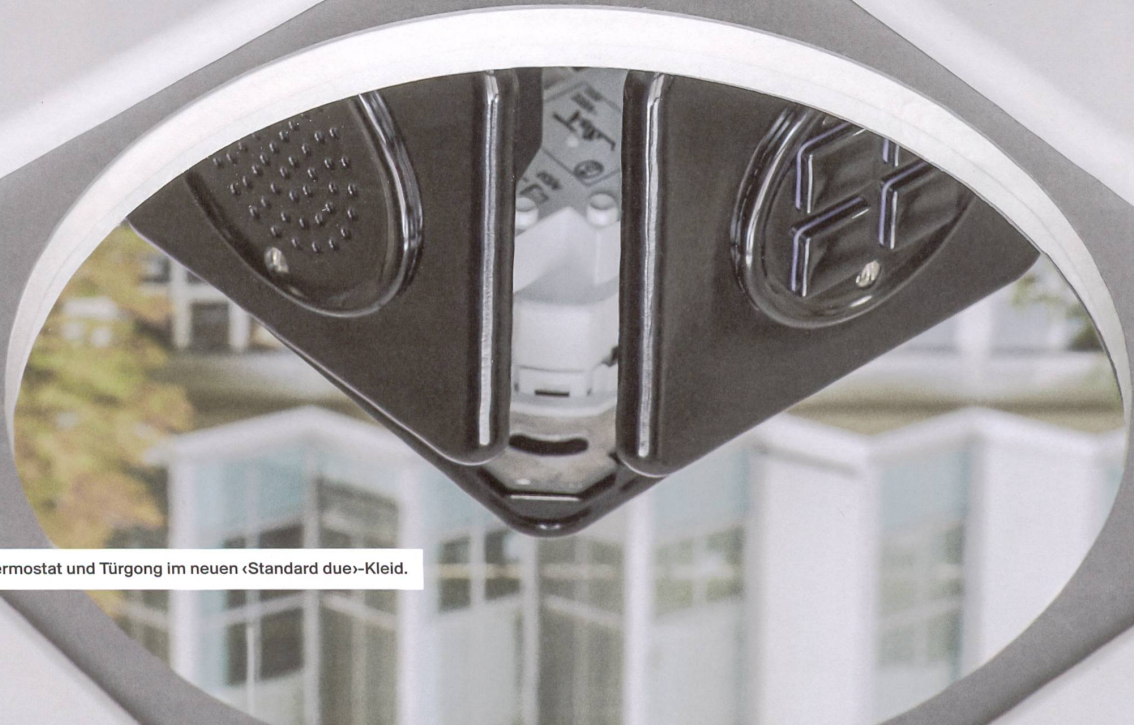
Schalter, Thermostat und Türgong im neuen «Standard due»-Kleid.