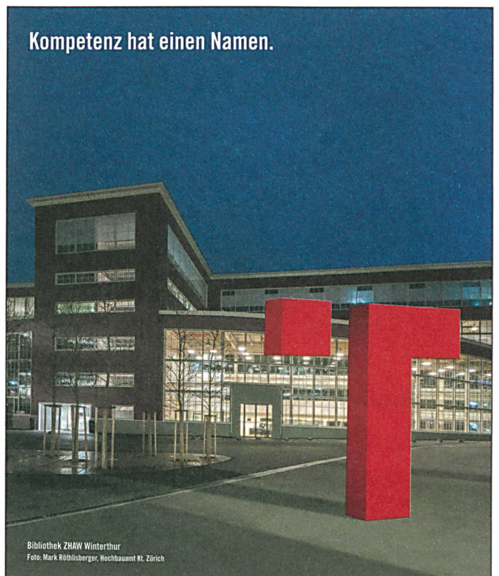
Bibliothek ZHAW Winterthur