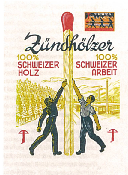
Seit 1938 gehört die Zündholzfabrik in Unterterzen zu HIAG.

Immer wieder ging HIAG geschickte Kooperationen ein. Ein besonders kluger Schachzug war, dass sie sich in den 1960er-Jahren von der österreichischen Doka die Schweizer Generalvertretung für deren äusserst erfolgreiches Betonschalungssystem sicherte. Die Betonschalungsbranche war ein noch junger Industriezweig, und mit Doka – die Schweizer Vertretung hiess ab 1983 Holzco-Doka – hatte HIAG «einen Partner gefunden, der seine Marktstellung dank seines weltweiten Absatzmarktes, der Grossproduktion mit modernsten Maschinen, der konstant betriebenen Forschung und Entwicklung und des weltweiten Informations- und Erfahrungsaustausches (...) ständig ausbaute», wie 1997 an einer Medienkonferenz erläutert wurde. Im Zuge der Neuorientierung der HIAG ging die Generalvertretung vor einigen Jahren zurück an den Umdasch-Konzern, zu dem Doka gehört. →