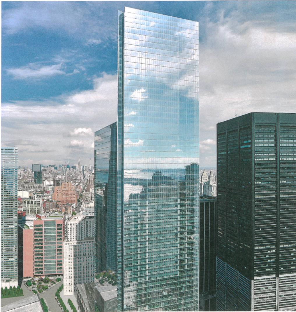
4 World Trade Center, New York