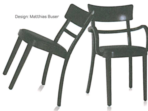
Design: Matthias Buser

„Inhalte werden schnell vergessen. Doch der emotionelle Eindruck guten Designs bleibt.“