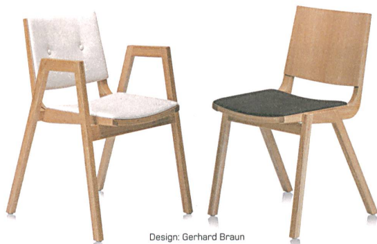
Design: Gerhard Braun