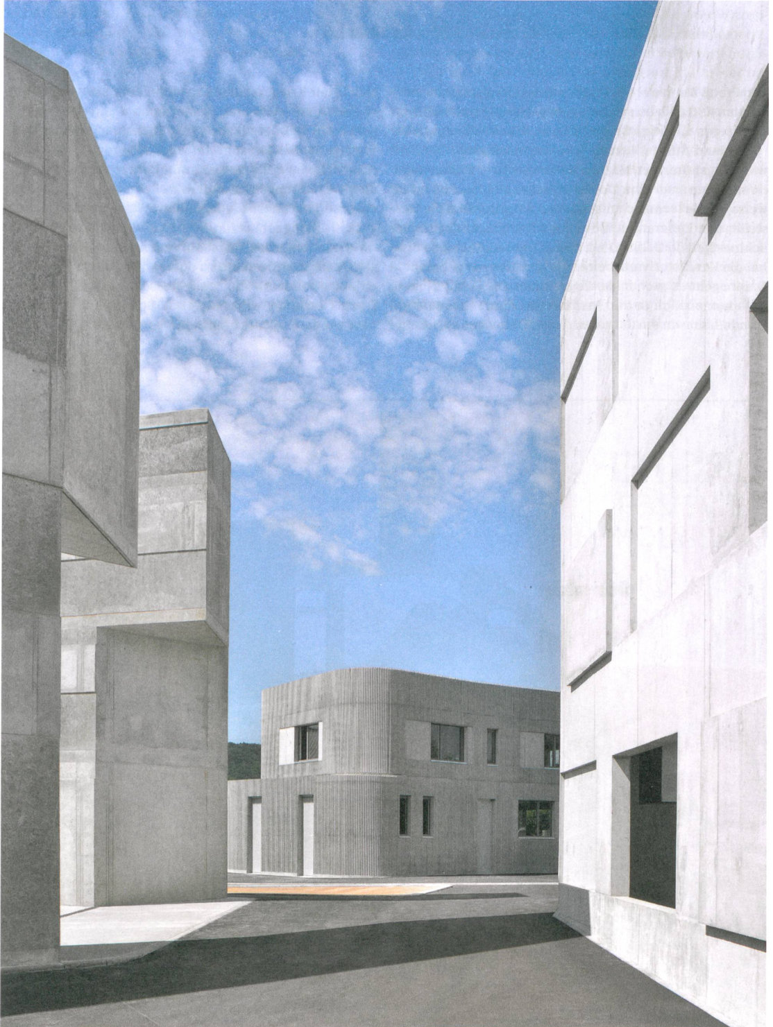
Sichtbeton vom Feinsten: Im Übungsdorf in Andelfingen lernen Polizistinnen, Feuerwehrleute und Zivilschützer auch einiges über Architektur.

Text: Andres Herzog