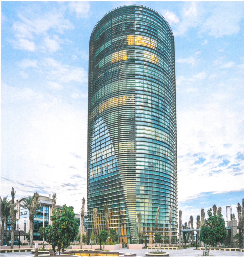
Alturki Business Park Al-Kohbar, Saudi Arabia