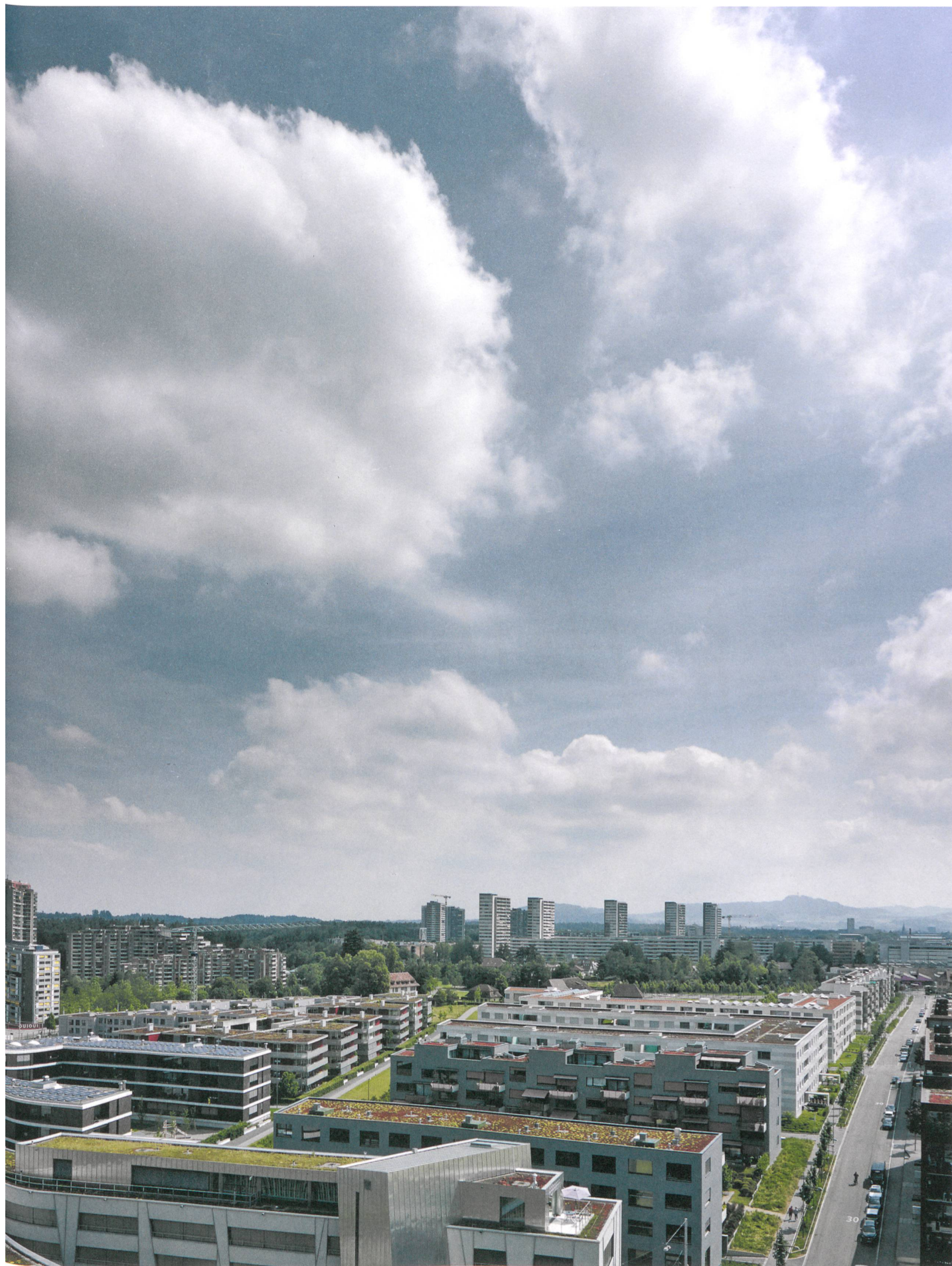
Brünen im Sommer 2014. Die hochfliegende Idee war eine «klassische Stadt in zeitgemässer Form». Entstanden ist ein Feld von Siedlungen.