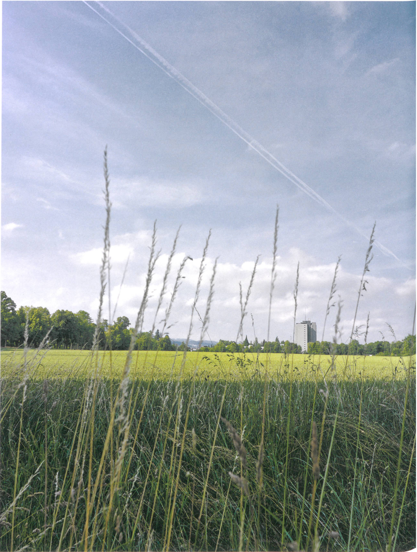
Noch wogen die Halme auf dem Viererfeld. Die Überbauung des Grundstücks wird und muss in Bern noch viel zu reden geben.