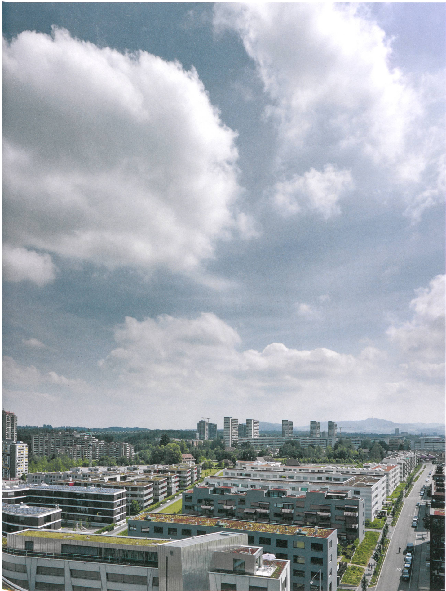
Brünen im Sommer 2014. Die hochfliegende Idee war eine «klassische Stadt in zeitgemässer Form». Entstanden ist ein Feld von Siedlungen.