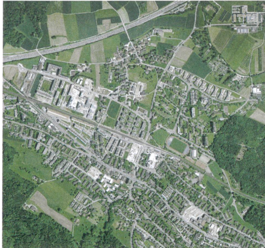
Heutige Zersiedelung in Zürich-Affoltern. | Huidige bebouwing in Zürich-Affoltern.