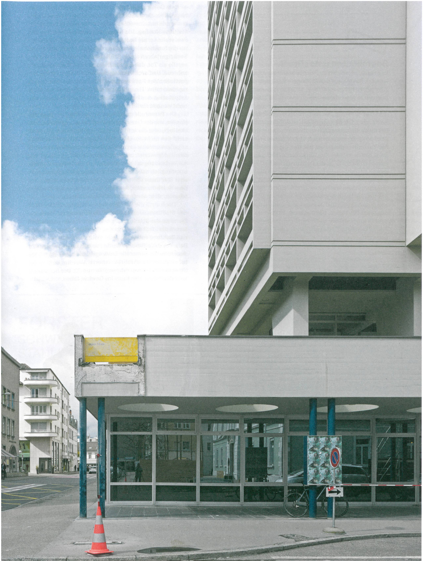
Übrig bleibt ein Stumpf: Im März liess die Stadt Olten über Nacht die Passerelle amputieren, die auf die Dachterrasse des Stadthauses führte.