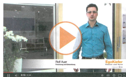
EgoKiefer Holz/Aluminium Hebeschiebetüre XL®2020 und EgoKiefer Kunststoff/Aluminium Hebeschiebetüre XL®2020.

Zu den Produktvideos: www.egokiefer.ch/innovationen