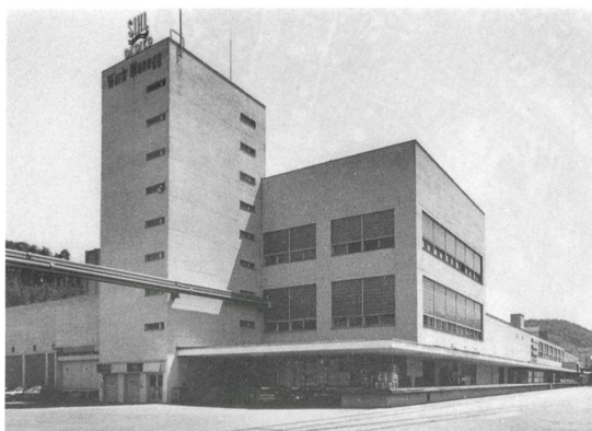
Der Wasserturm und der «Holländerbau» sollen erhalten bleiben.