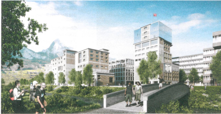
Schönes neues Brunnen Nord: So stellt man sich den Umbau in ein städtisches Quartier vor.