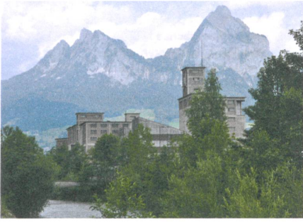
Das Areal der Zementfabrik mit eindrücklichen Bauten, die zum Teil zwischengenutzt werden.