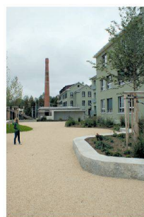
Umnutzung Industrieareal Forsanose, Volketswil ZH Schmid Landschaftsarchitekten