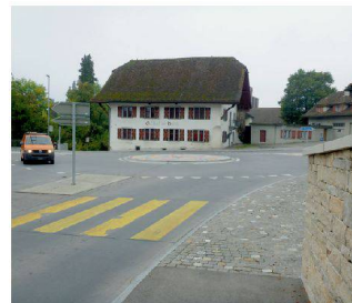
Ausbau Knoten Bären, Möriken AG SKK Landschaftsarchitekten