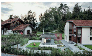
Privatgarten, Carrera GR Tobler Landschaftsarchitekten und Zuber Aussenwelten