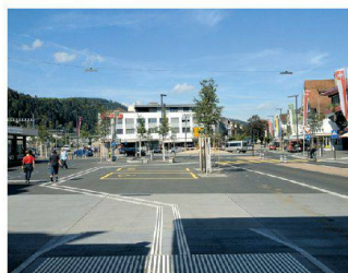
Neugestaltung Bahnhofgebiet Süd, Wattwil SG Rita Mettler Landschaftsarchitektur