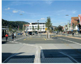
Neugestaltung Bahnhofgebiet Süd, Wattwil SG Rita Mettler Landschaftsarchitektur