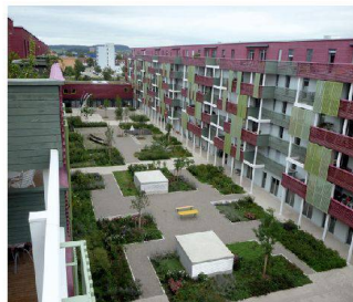
Hofgestaltung Mehrgenerationenhaus, Winterthur ZH Rotzler Krebs Partner