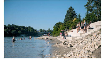
Stadtpark Ost, Rheinfelden AG Planikum