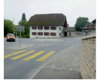
Ausbau Knoten Bären, Möriken AG SKK Landschaftsarchitekten