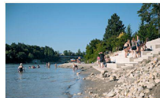
Stadtpark Ost, Rheinfelden AG Planikum