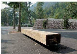
Jugendherberge und Raiffeisenbank, Interlaken BE BBZ Landschaftsarchitekten