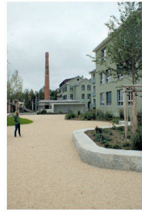
Umnutzung Industrieareal Forsanose, Volketswil ZH Schmid Landschaftsarchitekten