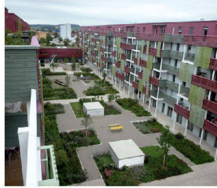
Hofgestaltung Mehrgenerationenhaus, Winterthur ZH Rotzler Krebs Partner