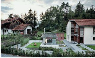
Privatgarten, Carrera GR Tobler Landschaftsarchitekten und Zuber Aussenwelten