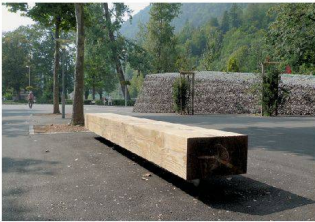
Jugendherberge und Raiffeisenbank, Interlaken BE BBZ Landschaftsarchitekten