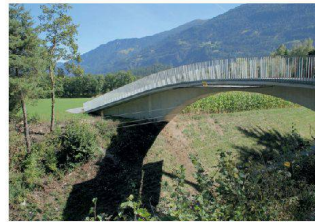
Wegüberführung Gurgs, Bonaduz GR Conzett Bronzini Gartmann