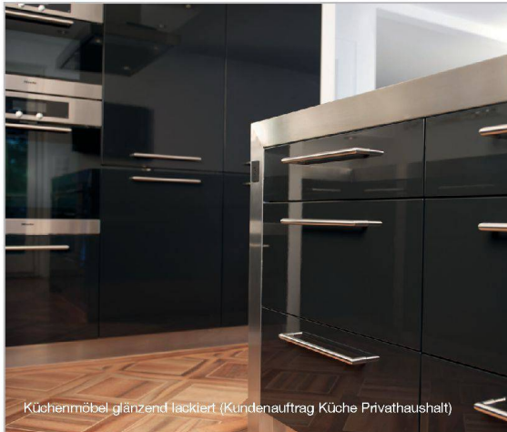
Küchenmöbel glänzend lackiert. (Kundenauftrag Küche Privathaushalt)

Swissbau Basel, 21. – 25. 01. 2014 Hauptstand Halle 1.0, Stand A20 Sonnenenergie-Systeme Halle 1.2, Stand B64