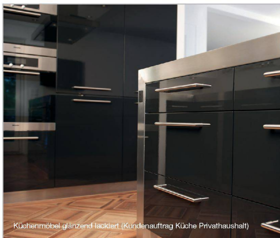
Küchenmöbel glänzend lackiert. (Kundenauftrag Küche Privathaushalt)

Swissbau Basel, 21. – 25. 01. 2014 Hauptstand Halle 1.0, Stand A20 Sonnenenergie-Systeme Halle 1.2, Stand B64