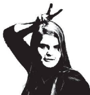
Out und erbaut

Das Buch «Grundrissfibel. 50 Wettbewerbe im gemeinnützigen Wohnungsbau», das die Edition Hochparterre mit dem Zürcher Amt für Hochbauten herausgegeben hat, ist ein Bestseller. Bereits ist die vierte Auflage ausverkauft. Die Neuauflage kommt bestimmt, aber wohl erst 2014 oder 2015. Bis dahin bleibt Entwurfsverweifelten wohl nur noch das Angebot der Berliner Buchhandlung «Pro qm», die ein noch verschweisstes Exemplar besitzt. Allerdings ist das nicht ganz billig: Sie bietet es auf Amazon für 499,99 Euro an.