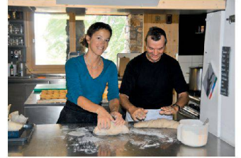
Brot backen in der Terri-Hütte. | Baking bread at the Terri Hut.