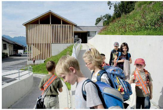
Die Kleinen marschieren nach Hause: Kindergarten in Thüringerberg. | Little ones on their way home: Nursery school in Thuringerberg.