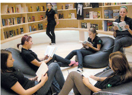
Die angehenden Bäuerinnen lesen in der Bibliothek des Agrarbildungszentrums in Altmünster. | Prospective farmers read in the library at the agricultural training centre in Altmünster.

Weitere Daten und Ausstellungsorte | Other dates and exhibition venues: www.constructivealps.net