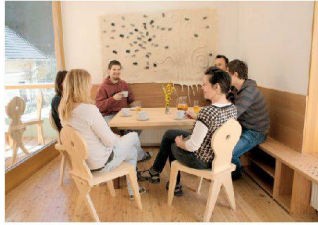
Gäste stossen im Zentrum Rinka in Solčava an. | Guests raise their glasses at Rinka Centre in Solčava.