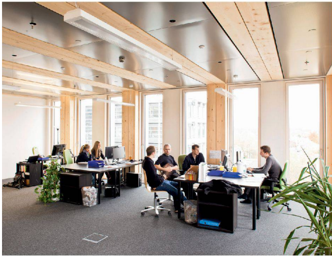
Im LifeCycle Tower One arbeitet man im Holz. | At work with "wood" at the Life Cycle One Tower.