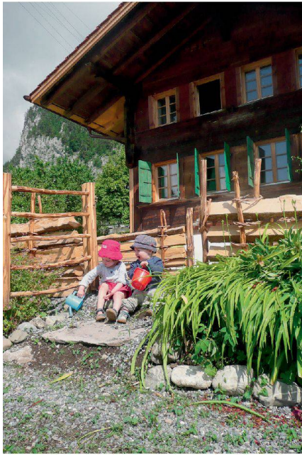
Auch die ganz Kleinen machen Ferien im Baudenkmal in Boltigen. | Even the very youngest can enjoy holidays at the historic building in Boltigen.