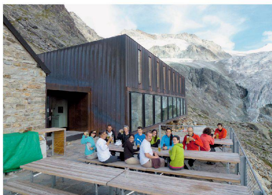
Der Aufstieg ist geschafft: Wanderer erfrischen sich auf der Terrasse der Moiry-Hütte. | Made it to the top: hikers enjoy rest and refresh- ment on the terrace at the Moiry Hut.