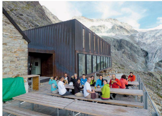
Der Aufstieg ist geschafft: Wanderer erfrischen sich auf der Terrasse der Moiry-Hütte. | Made it to the top: hikers enjoy rest and refreshment on the terrace at the Moiry Hut.