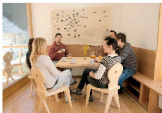
Gäste stossen im Zentrum Rinka in Solčava an. | Guests raise their glasses at Rinka Centre in Solčava.