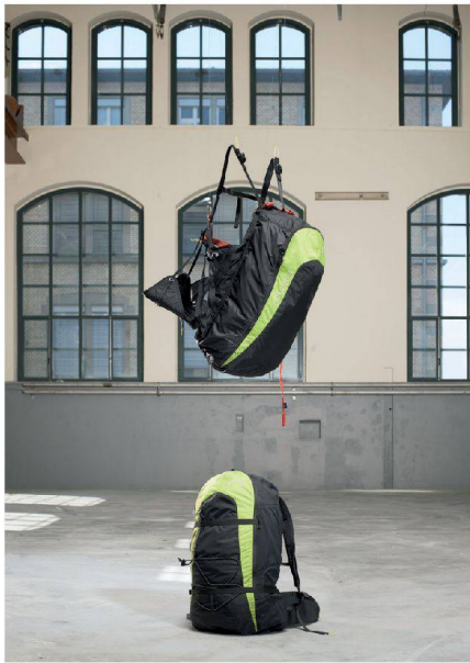
Klassische Designarbeit: Das Gurtzeug dient beim Aufstieg als aufgeräumter, schlanker Rucksack für den Gleitschirm.