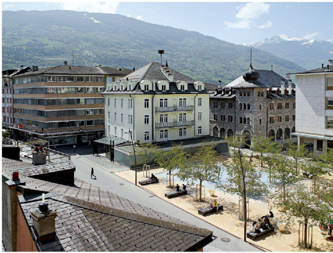
Espace des Remparts: zwischen Kirschbäumen der obligatorische Springbrunnen.

→ ist hier der obligatorische Springbrunnen zu finden: Aus der bodenebenen Wasserfläche schiessen die senkrechten Wassersäulen in die Luft. Es stehen Metallgestelle herum, die zu Grünhäusern werden sollen, doch noch haben die Kletterpflanzen ihr Werk nur halb getan.