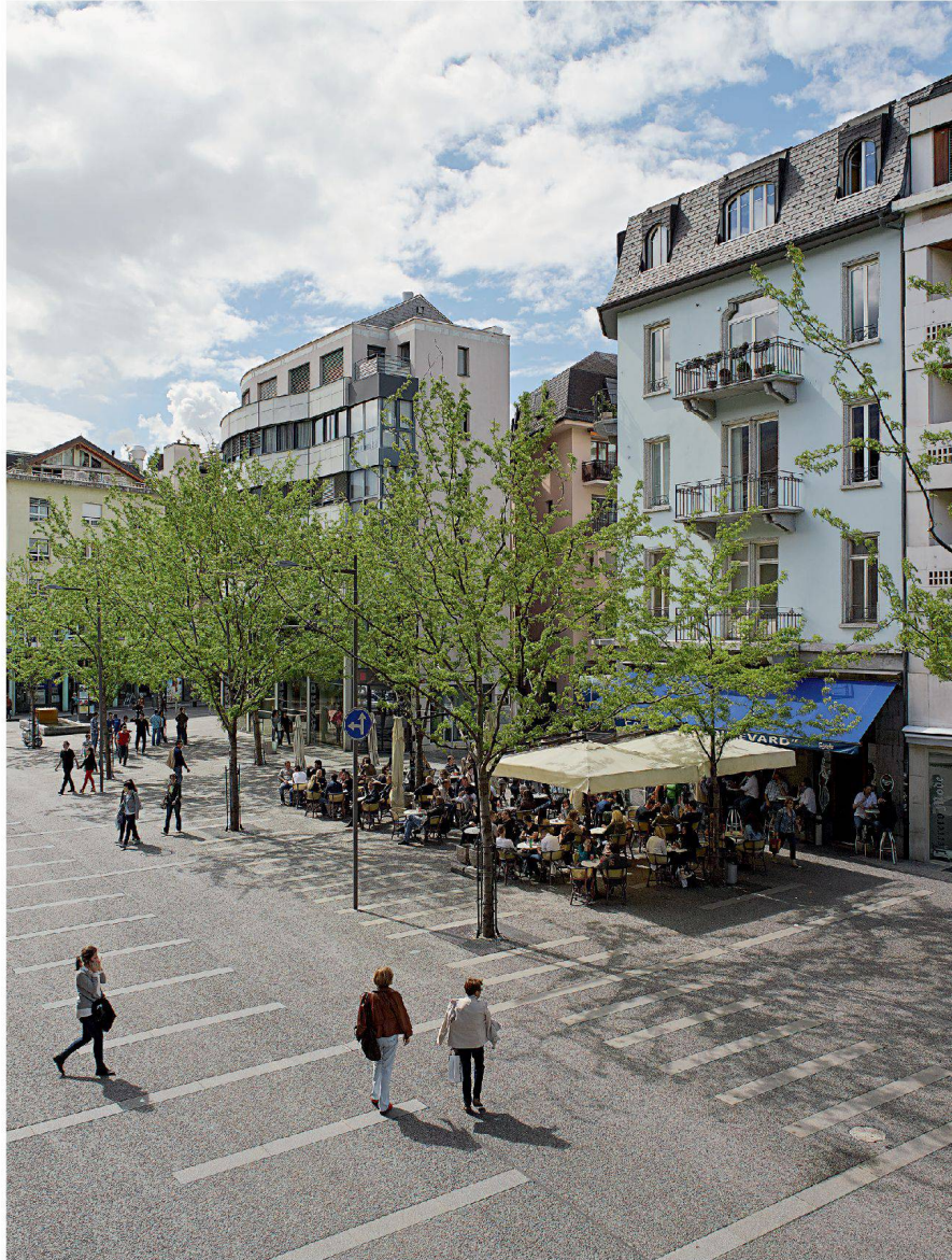
Place du Midi: stadtauglich umgebaut. An der Beizenfront sitzt, trinkt und schwatzt tout Sion.

Schliesslich noch die Espace des Remparts, ein städtisches Terrain, auf dem eine Reihe einstöckiger Garagen stand. Sie haben einem Pocket-Park Platz gemacht. Kirschbäume stehen in der Kiesfläche, und selbstverständlich →