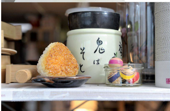
^In den Regalen und auf den Ablagen gab es einiges zu entdecken: vom Plastik-Sushi bis hin zu Origami-Pommes.