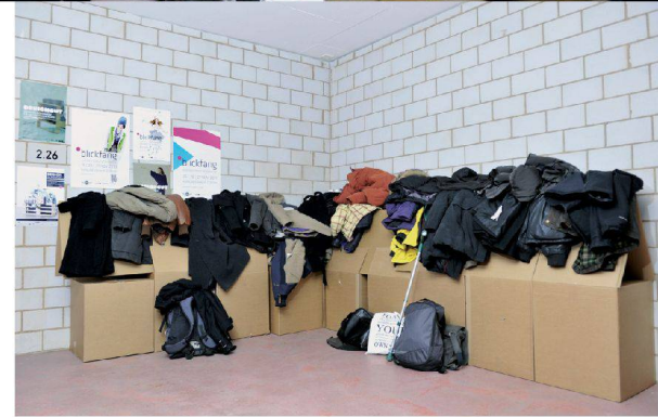
^Die improvisierte Garderobe im Vorraum des Ateliers.