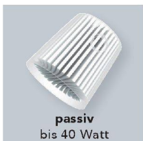
passiv bis 40 Watt