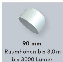
90 mm Raumhöhen bis 3,0 m bis 3000 Lumen