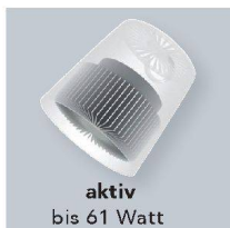
aktiv bis 61 Watt