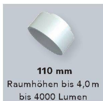
110 mm Raumhöhen bis 4,0 m bis 4000 Lumen