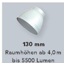
130 mm Raumhöhen ab 4,0 m bis 5500 Lumen