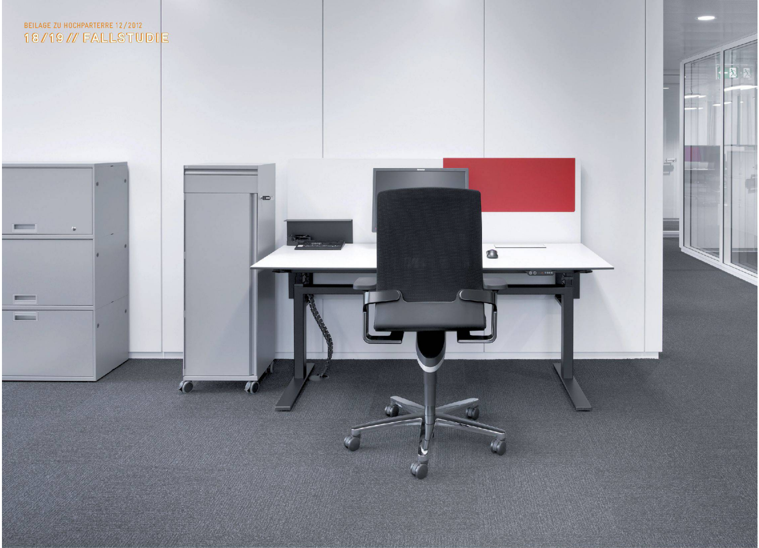
^Der persönliche Caddie steht während der Arbeitszeiten neben dem Tisch. Seine Höhe ist mit einem zusätzlichen Fach dem Büromöbel nebenan angepasst.