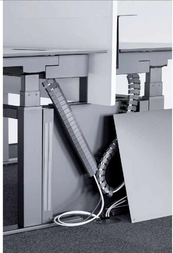
>Einfach, aber wirksam: Ein magnetisch befestigtes Panel deckt die Stromzufuhr ab.