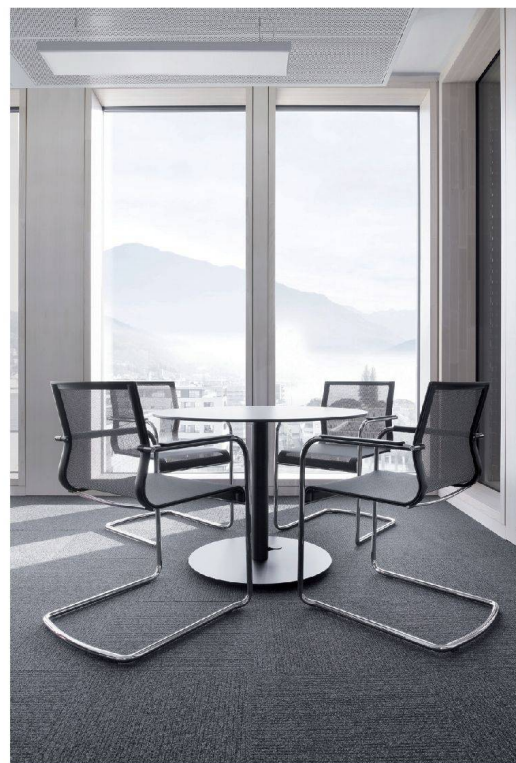
^Einzig der kleine runde Besprechungstisch kommt unverändert aus dem Katalog der Lista Office LO.