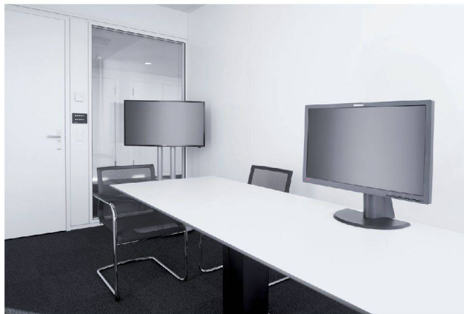
<Für das Einzelbüro wurde der Arbeitstisch verlängert. So können daran auch kleine Besprechungen stattfinden.