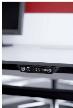
<Die Arbeitsfläche ist elektronisch höhenverstellbar.