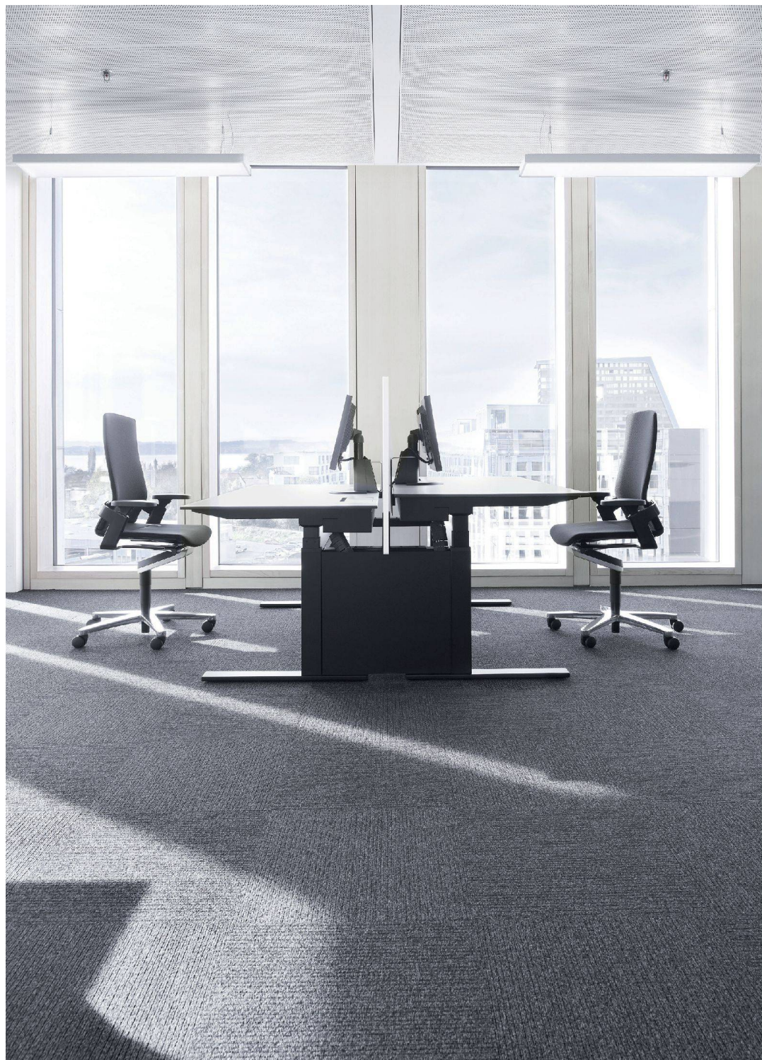
^1074 Arbeitsplätze warten nun auf rund 1300 Mitarbeitende.