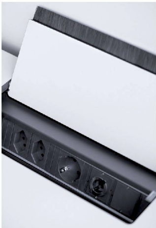
<In die Stromschiene passen auch nicht-europäische Stecker. Eine Klappe schützt vor Staub.