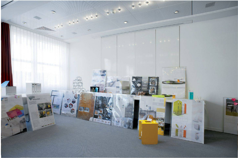
<Diese Eingaben brachten es bis in die letzten Runden.