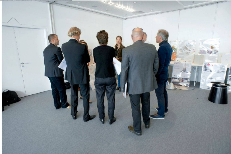
^ Schauen, bewerten, diskutieren.