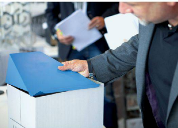
^Juryarbeit heisst auch, die Vorschläge zu testen.