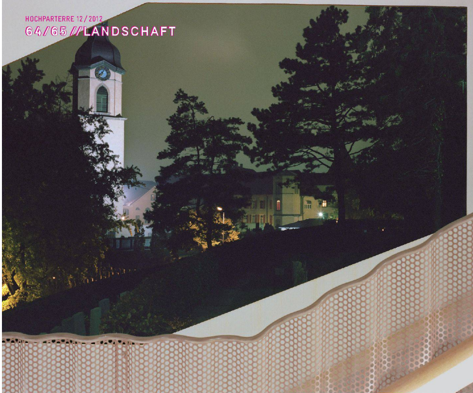
^Präzis ins Blech geschnittene Öffnungen geben Ausblicke auf die Stadt frei.