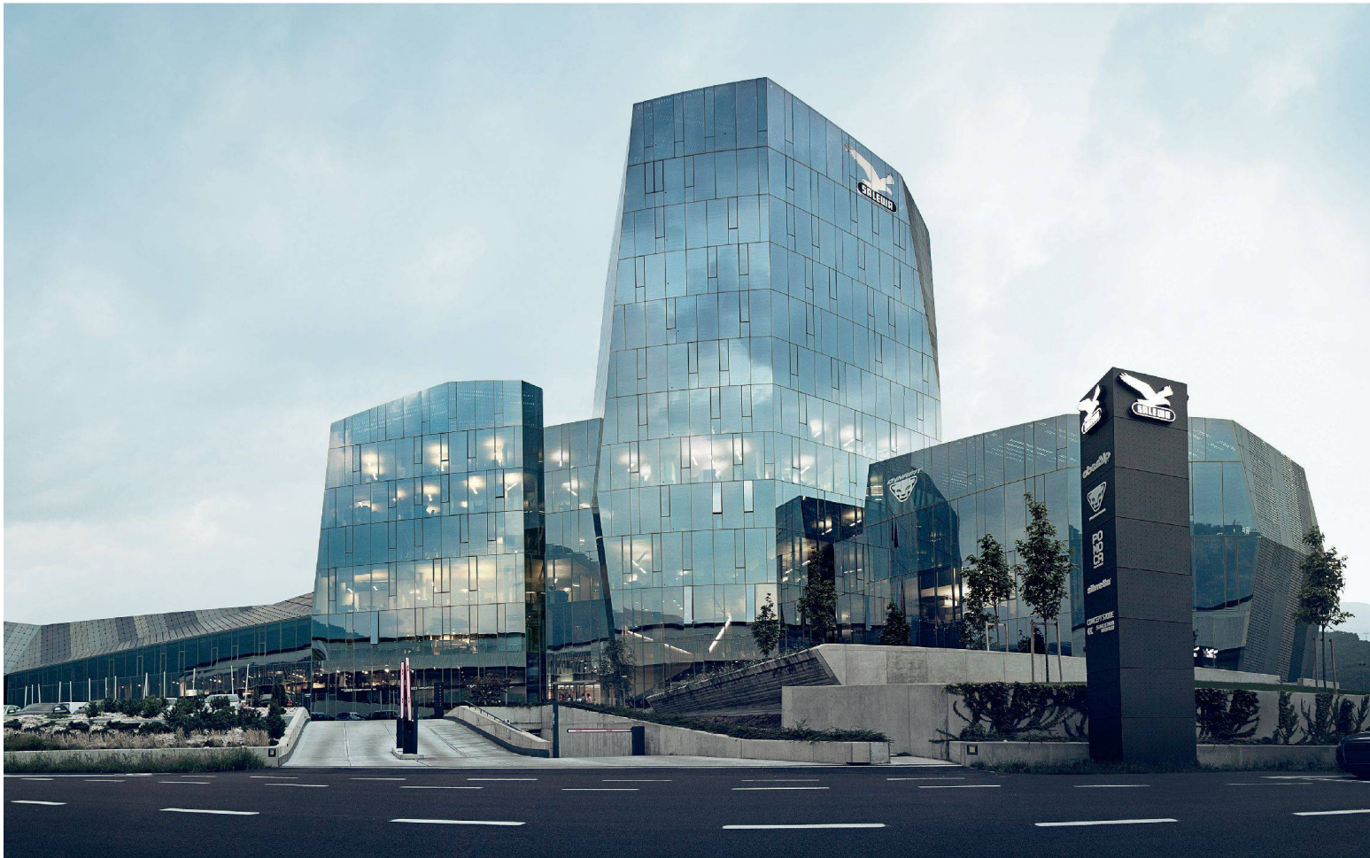
SALEWA Headquarter, Bozen / IT Cino Zucchi Architeti / Park Associati

„Im neuen Hauptsitz von SALEWA spiegeln sich sämtliche Bedürfnisse eines modernen, dynamischen Unternehmens wider. Indem wir den Wünschen von SALEWA nach einem ökologisch, wirtschaftlich und sozial nachhaltigen Gebäude nachkamen, ist es uns gelungen, einen Ort der Interaktion und Kommunikation zwischen Mitarbeitern, Kunden und Partnern zu schaffen. Das Lichtkonzept trägt wesentlich zur Entstehung eines Arbeits- und Lebensumfelds bei, in dem sich die Menschen wohlfühlen und das gleichzeitig im Einklang mit der Umwelt steht.“