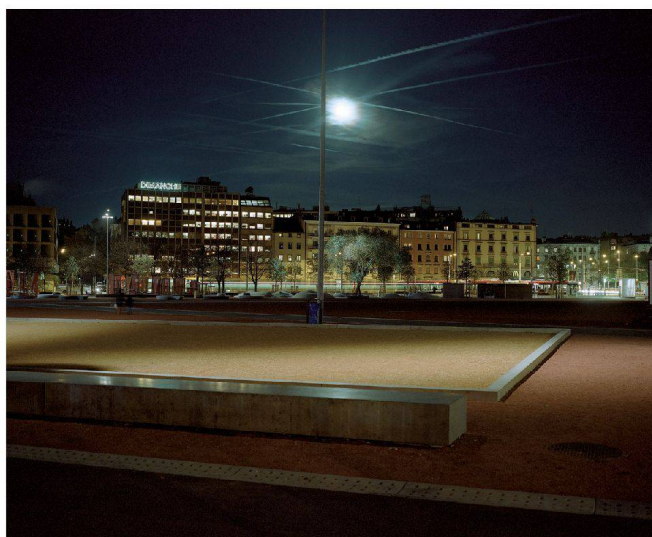
52__ Landschaft: Gold für die Plaine de Plainpalais in Genf.

Cover__ Hase auf der Jagd nach den Besten, die Besten auf der Jagd nach Hasen.