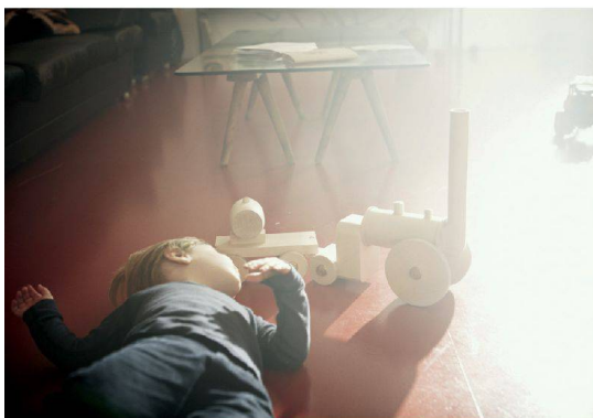
36__ Design: Gold für «Home Made» von Postfossil.