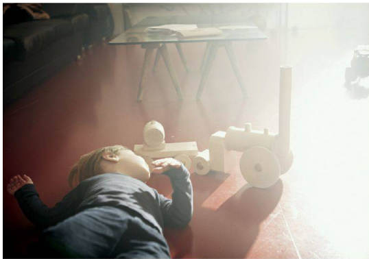
36__ Design: Gold für «Home Made» von Postfossil.