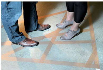
<In der Fabrikationshalle stehen für einmal schicke Schuhe.