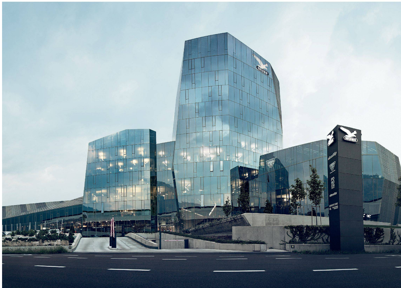
SALEWA Headquarter, Bozen / IT Cino Zucchi Architetti / Park Associati

„Im neuen Hauptsitz von SALEWA spiegeln sich sämtliche Bedürfnisse eines modernen, dynamischen Unternehmens wider. Indem wir den Wünschen von SALEWA nach einem ökologisch, wirtschaftlich und sozial nachhaltigen Gebäude nachkamen, ist es uns gelungen, einen Ort der Interaktion und Kommunikation zwischen Mitarbeitern, Kunden und Partnern zu schaffen. Das Lichtkonzept trägt wesentlich zur Entstehung eines Arbeits- und Lebensumfelds bei, in dem sich die Menschen wohlfühlen und das gleichzeitig im Einklang mit der Umwelt steht.“