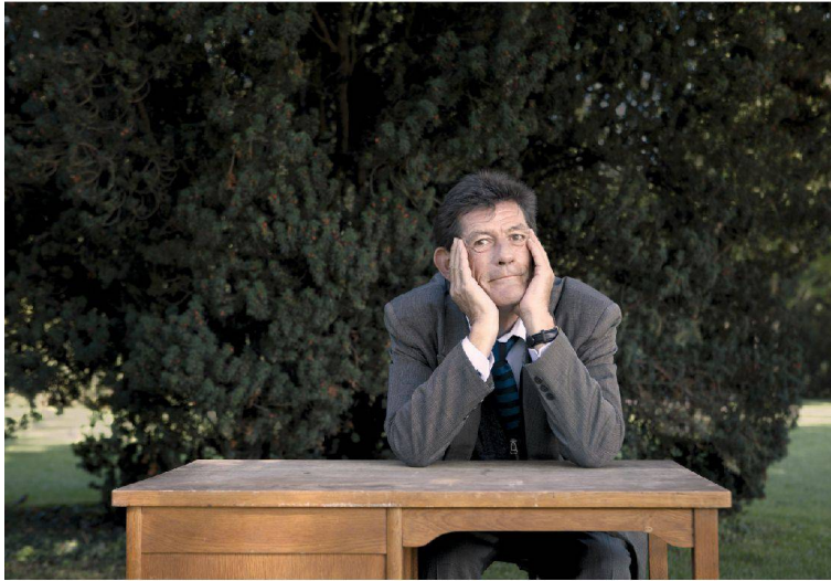
18__ André Vladimir Heiz: «Womit beginnt Gestaltung?»