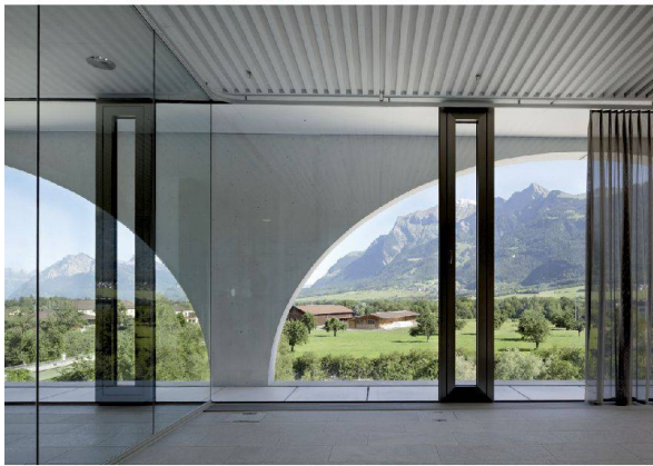
28__ Blick durch Bögen auf die Berge: ÖKK-Hauptsitz in Landquart.