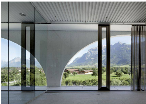
28__ Blick durch Bögen auf die Berge: ÖKK-Hauptsitz in Landquart.