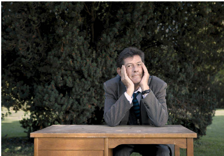
18__ André Vladimir Heiz: «Womit beginnt Gestaltung?»