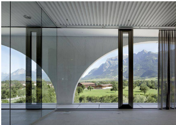
28__ Blick durch Bögen auf die Berge: ÖKK-Hauptsitz in Landquart.