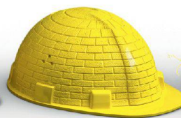
Mauerwerk & Betonelemente