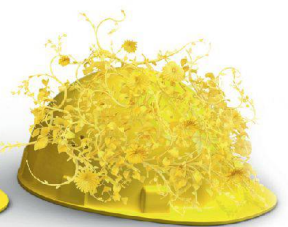
Nachhaltigkeit & Innovation

Auf die Erstellung hochkomplexer Klinker- und Sichtsteinfassaden haben wir unser Fundament gebaut. Dass wir visionär denken und entsprechend planen und realisieren, beweisen wir täglich in sämtlichen Bereichen unserer Geschäftsfelder. Wir schaffen Mehrwert, mit System am Bau: www.keller-ziegeleien.ch