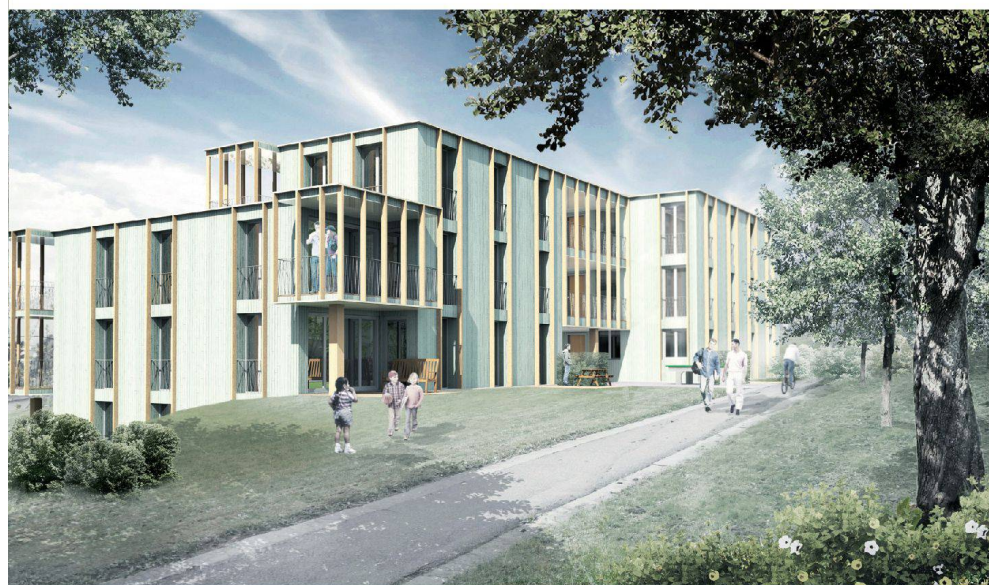
^Visualisierung des Neubaus, der die bestehenden beiden Wohnhäuser in Zürich-Seebach ersetzt.

sagt Wymann. So würden für bestimmte Aufgaben Pläne 1:500 genügen. Der Wettbewerb für die Ecole des Métiers in Fribourg etwa wurde in diesem Massstab juriiert. «Von den Architekten wird oft zu viel verlangt», moniert der SIA-Wettbewerbschürer. Üblicherweise ist der Massstab 1:200 gefordert, die Stadt aber verlangte bei der Felsenrainstrasse 1:100-Pläne. «Dadurch hatten alle Teilnehmer erheblich höheren Aufwand als bei einem normalen Wettbewerb», stellt Architekt Rolf Mühlethaler fest.