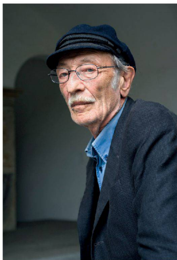
28__ Er über- treibt, spitzt zu, lässt weg: Der Tessiner Architekt Luigi Snozzi im Interview.