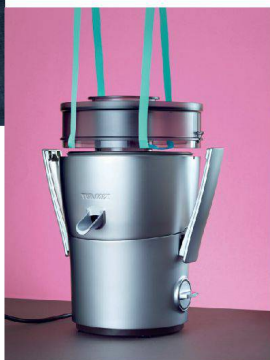
50__ Schlicht geformt: Turmix- Entsafter.

Cover__ Basler Rhein- hafen: Die Dreiländerregion will bei der Umnutzung Schub geben.