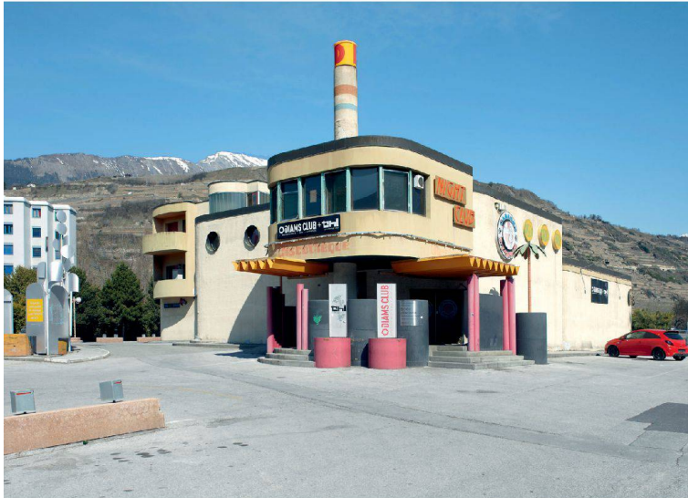
18__ Walliser Baukultur: bunter Fund in Sitten.

28__ Jacqueline und Nathalie Felber stehen an der Spitze der Sitzmöbelfirma Dietiker.