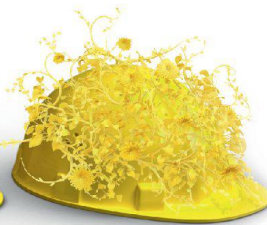
Nachhaltigkeit & Innovation

Auf die Erstellung hochkomplexer Klinker- und Sichtsteinfassaden haben wir unser Fundament gebaut. Dass wir visionär denken und entsprechend planen und realisieren, beweisen wir täglich in sämtlichen Bereichen unserer Geschäftsfelder. Wir schaffen Mehrwert, mit System am Bau: www.keller-ziegeleien.ch