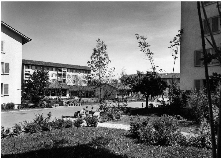
^Else-Züblin-Strasse, Zürich-Albisrieden, um 1955: Die Grünflächen fließen.