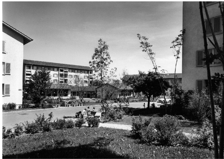
^Die Siedlung Else-Züblin-Strasse heute: breite Wege, Rampen und sechs- und siebengeschossige Häuser – die Grünflächen aber fließen nicht mehr.