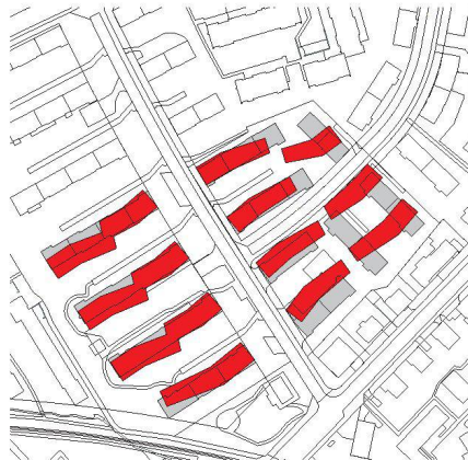
^2_Wasserschöpfli: ähnliche Struktur, aber höher.