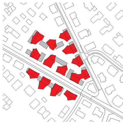
^4_Toblerstrasse: Kammerungen statt Abstandsgrün.