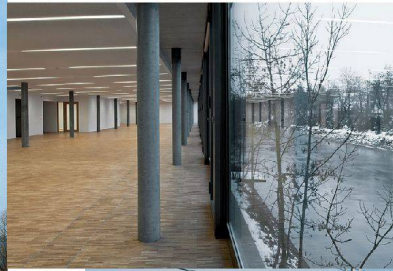
<9_Neue Büroräume in der ehemaligen Initialsprengstoffanlage der RUAG.