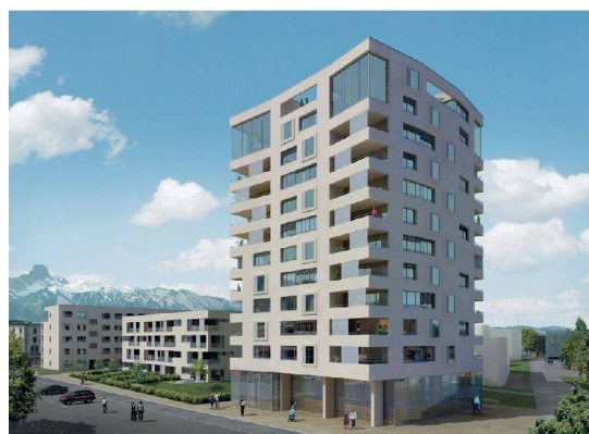
^16_Wohnüberbauung Selve, im Bau.