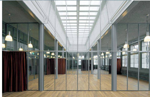
^12_Einbau einer Kindertagesstätte in der Industriehalle auf dem RUAG-Areal.